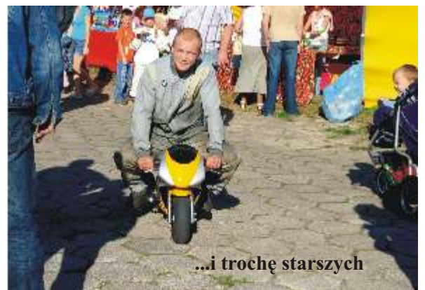
...i trochę starszych

Tu każdy mógł znaleźć coś dla siebie. Dzieci miały frajdę skacząc na batutach i bawiąc się na nadmuchiwanym zjeżdżalniach. Starsi mogli przejechać się na quadzie lub wykupić lot widokowy nad Słupskiem. Wszyscy z zapartym tchem patrzyli w niebo, gdzie co jakiś czas pojawiali się spadochroniarze na barwnych spadochronach. Jednak prawdziwe owacje wywołał występ grupy "Żelazny" z Aeroklubu Ziemi Lubuskiej. Podniebne akrobacje zatykały dech w piersiach, a przeloty na niewielkiej wysokości wzbudzały - zwłaszcza w młodszych widzach - okrzyki zachwytu. Pętle, becзки, immelmany i opadanie liściem - figury wykonywane przez zwrotne maszyny budziły podziw.