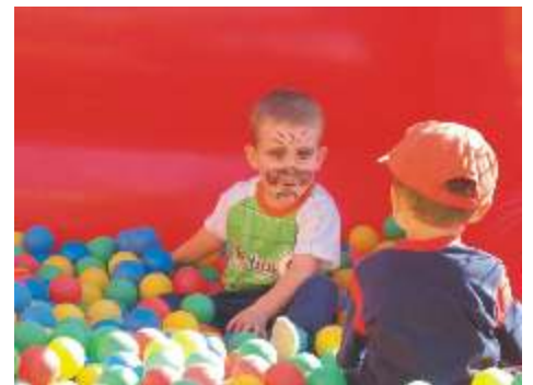
Na lotnisku coś dla maluchów...

kilku kursach przyjeżdżali na imprezę. Tu każdy mógł znaleźć coś dla siebie. Dzieci miały frajdę skacząc na batutach i bawiąc się na nadmuchiwanym zjeżdżalniach. Starsi mogli przejechać się na quadzie lub wykupić lot widokowy nad Słupskiem. Wszyscy z zapartym tchem patrzyli w niebo, gdzie co jakiś czas pojawiali się spadochroniarze na barwnych spadochronach. Jednak prawdziwe owacje wywołał występ grupy "Żelazny" z Aeroklubu Ziemi Lubuskiej. Podniebne akrobacje zatykały dech w piersiach, a przeloty na niewielkiej wysokości wzbudzały - zwłaszcza w młodszych widzach - okrzyki zachwytu. Pętle, becзки, immelmany i opadanie liściem - figury wykonywane przez zwrotne maszyny budziły podziw.