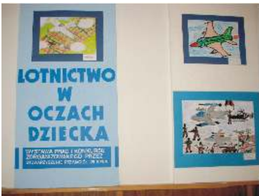
Wystawa plastyczna w Klubie Garnizonowym