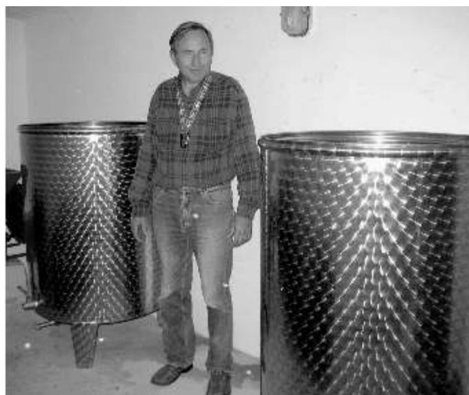
Kadzie z winem; właściciel chce powiększyć winnicę do 1,5 hektara

W tym roku na 0,7 hektara upraw, krzewy aż uginały się od winogron. - Ludzie przystawali samochodami przy drodze i pytali, co to jest i czy prawdziwe - opowiada właściciel winnicy. Nastawił