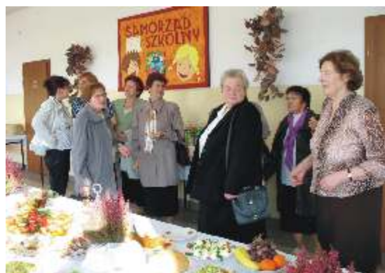
Poczęstunek dla wszystkich

Jubileusz już za nami. Na następny trzeba poczekać przynajmniej pięć lat, lecz miłe to będzie oczekiwanie, wspominając minione święto.