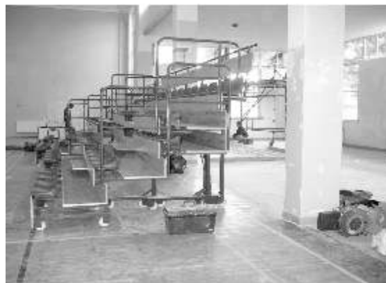
Kiedy trzeba, trybuny można cofnąć i organizować zawody sportowe

Do tej pory sala gimnastyczna przypominała każdą inną, połączoną ze szkolnym budynkiem. Nie było mowy, aby urządzić w niej większe rozgrywki sportowe czy występy z udziałem publiczności, bo nie było miejsca dla widzów.