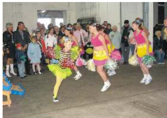
Zespół z Rogawicy w swoim popisowym numerze

W trakcie imprezy nie zbrakło występów i poczęstunku. Widzowie gorąco oklaskiwali