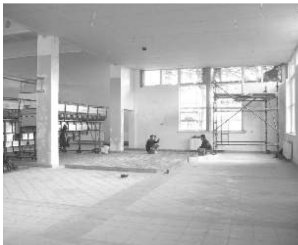
Większe pomieszczenie powstaje przez cofnięcie trybun na boisko

Szkole Podstawowej w Bierkowie przybyło powierzchni. Wszystko za sprawą rozbudowy i dobudowy pomieszczeń do istniejącej sali gimnastycznej.