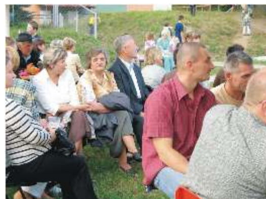
Publiczność dopisała dzięki pięknej pogodzie