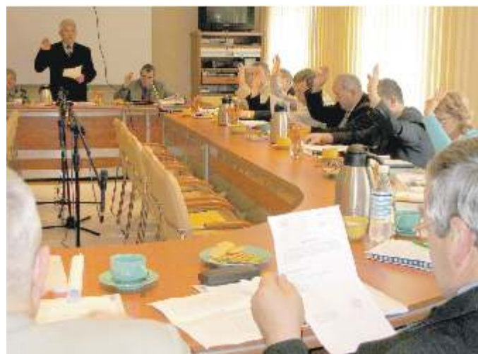
Decyzja radnych była jednogłośna

Na nadzwyczajnej sesji zwołanej 10 października 2006 roku radni Rady Gminy Słupsk podjęli uchwałę o włączeniu prawie 130 hektarów w Redzikowie do Słupskiej Specjalnej Strefy Ekonomicznej. Było to możliwe dzięki nowelizacji ustawy o Specjalnych Strefach Ekonomicznych, która zakłada powiększenie specjalnych stref do momentu osiągnięcia przez nie określonej powierzchni (na terenie