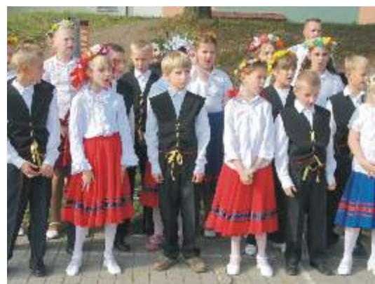
Występy dzieci z SP Głobino