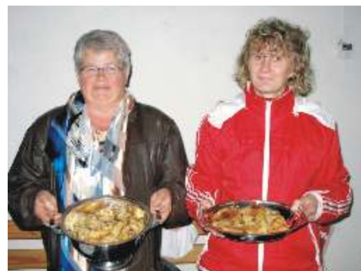
Panie z Bukówki z nagrodzoną roladą ziemniaczaną