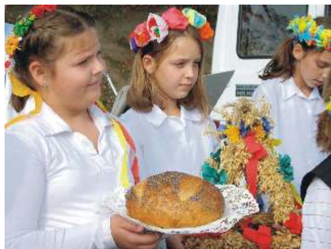
Obrzędy dożynkowe przedstawione przez uczniów szkoły w Głobinie