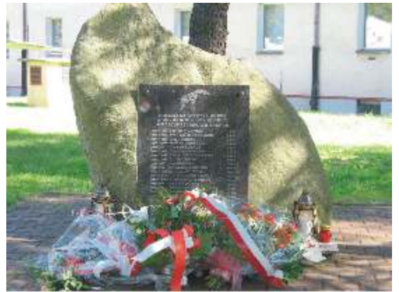
Pomnik poległych pilotów

Tego dnia lotnisko w Redzikowie od samego rana było pełne ludzi, a życie na nim toczyło się jak za najlepszych, pułkowych czasów. 23 września 2006 roku, na "Piknik z mocą", przyjechał i przyleciał sprzęt,