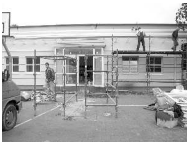
Wejście od strony boiska - na zdjęciu jeszcze w budowie