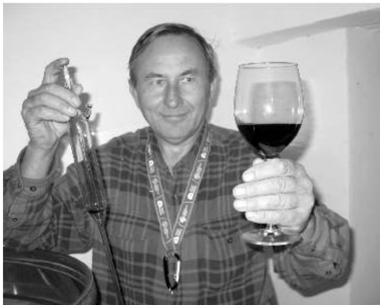
Czerwone jak krew wino z globińskiej winnicy