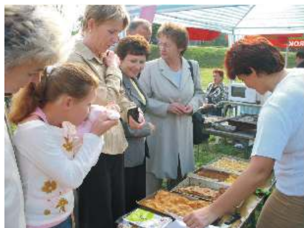
Stoisko Caritasu w Głobinie oblegane przez amatorów słodczych