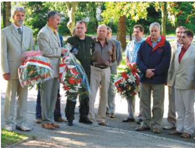
Wiązanki kwiatów w dowód pamięci

Tego dnia lotnisko w Redzikowie od samego rana było pełne ludzi, a życie na nim toczyło się jak za najlepszych, pułkowych czasów. 23 września 2006 roku, na "Piknik z mocą", przyjechał i przyleciał sprzęt,