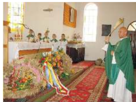
Poświęcenie wieńców dożynkowych