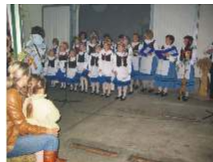
Kaszubski zespół z Cewic