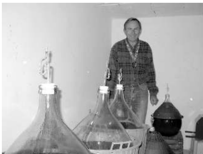
W każdym baniaku inny gatunek winogron