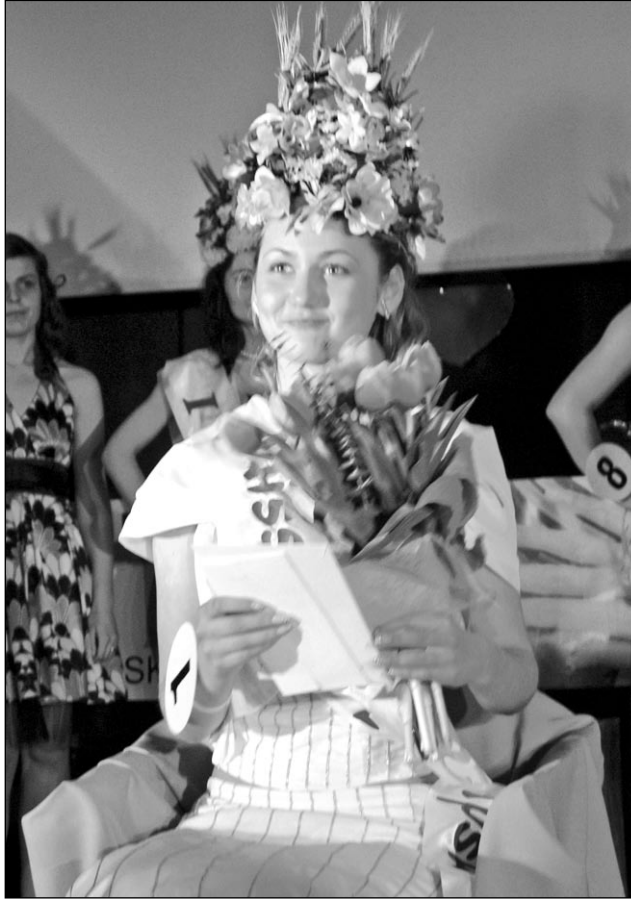
Podpis pod zdjęcie – Zeszłoroczna zwyciężczyni zachęca do udziału w Wyborach Miss Gminy Słupsk.

Udział w konkursie mogą wziąć panny, które ukończyły 18 rok życia oraz są zameldowane na terenie Gminy Słupsk. Serdecznie zapraszamy do zabawy.