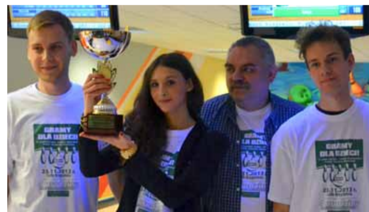
Głos Pomorza - Zwycięzca turnieju.