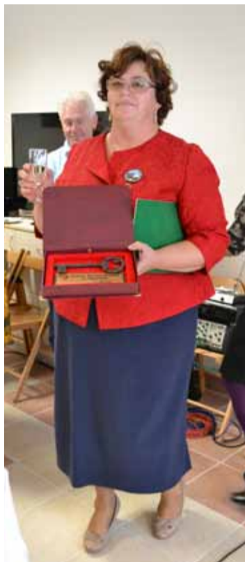
Pani Sołtys z kluczem do świetlicy