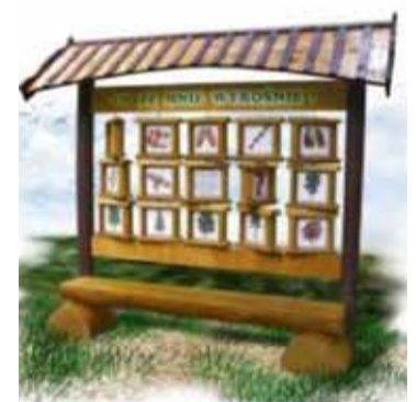
Gra typu MEMO „Co ze mnie wyrośnie”

„Przyjazna wieś - budowa 1 miejsca infrastruktury integracyjno – rekreacyjnej w miejscowości Krępa Słupska wraz z organizacją imprezy promocyjnej” współfinansowanego ze środków Programów Rozwoju Obszarów Wiejskich 2007-2013, Oś 4 LEADER w ramach „Małych projektów”. Całkowity koszt przedsięwzięcia to 25 172,25 tysięcy złotych. 8 204,36 tysięcy złotych stanowił wkład własny, reszta środków pochodzi ze środków Unii Europejskiej.