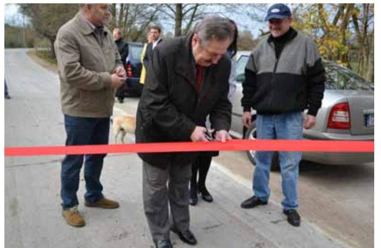
Wicestarosta Słupski przecina wstęgę.

częściej stosowana jest w całym kraju. Beton wałowany nie daje spektakularnych oszczędności, ale w stosunku do powszechnie stosowanej „konkurencji” może poszczycić się trwałością i oszczędnością czasu. Ponad półtora kilometra drogi kładzie się zwykle ok. tygodnia. Przy zastosowaniu nowej technologii już trzeciego dnia po nowej nawierzchni mogły poruszać się pojazdy. Odcinek Wrzeście – Kępno jest prawdopodobnie najdłuższym w kraju wykonanym tą technologią.