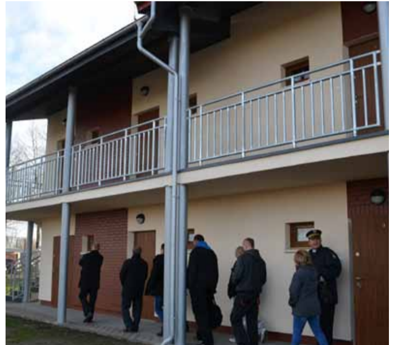
Pełna fotorelacja na profilu Facebook'owym Gminy Słupsk