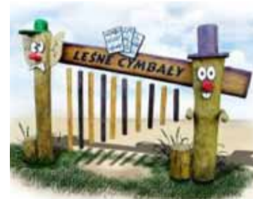
„Xylofon” - Leśne cymbały z przyróżeniem oka

8 grudnia odbędzie impreza plenerowa, która będzie jednocześnie finałem projektu pn. „Przyjazna Wieś”.