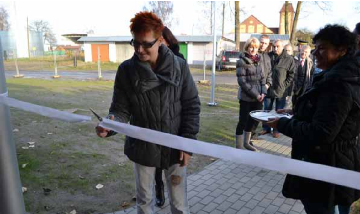
Wstęga przecięta, można się wprowadzać

mieszkań oraz zabezpieczenia przeciwwilgociowego. Łączny koszt I etapu budowy to 2 080 954,18 zł brutto. W tej kwocie znalazło się dofinansowanie z Banku Gospodarstwa Krajowego w kwocie 1.389.453,48 zł brutto. W kolejnych latach powstaną tutaj następne budynki. Ostatecznie na nowym osiedlu w Jezierzycach ma się znaleźć 48 mieszkań.