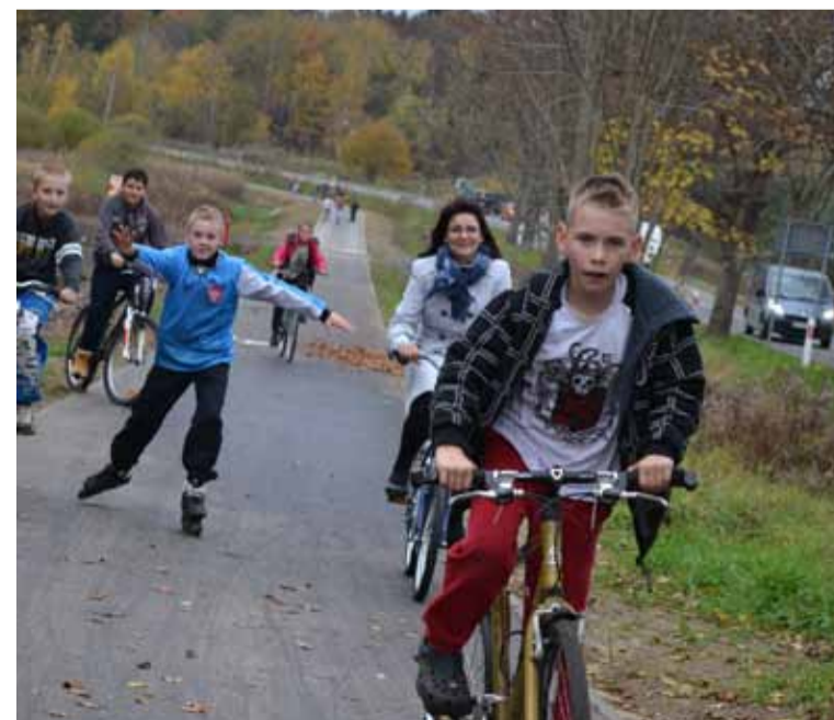
Pierwszy oficjalny test nowej ścieżki.

Projekt finansowany z budżetu Fundacji Partnerstwo Dorzecze Słupi przeznaczonego na Wdrażanie lokalnych strategii rozwoju.