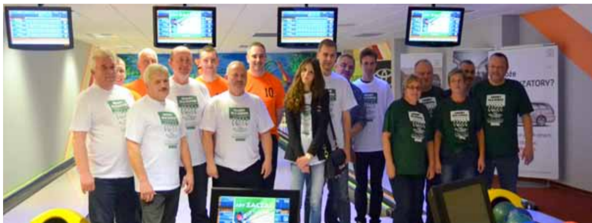
Finałowe cztery drużyny turnieju.