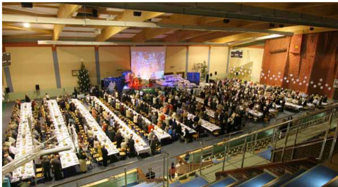
Czy w tym roku frekwencja na hali w Jezierzycach będzie większa? Przekonamy się 14 grudnia

z sołectw. Przy okazji tak ważnego jubileuszu, w tym roku spotkamy się przy jednym wspólnym stole na hali w Jezierzycach. Już dzisiaj zapraszamy wszystkich seniorów na to wyjątkowe wydarzenie.