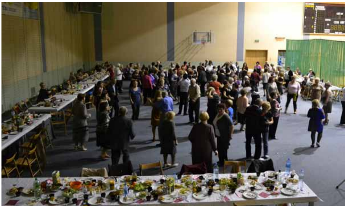
Parkiet w Jezierzycach nawet przez moment nie był pusty.

Wspólna zabawa zakończyła się o 23.00 a seniorzy z uśmiechami na twarzy już dyskutowali o kolejnym wspólnym spotkaniu. Najbliższe odbędzie się 14 grudnia i będzie to XX wigilia seniorów, która odbędzie się w tym samym miejscu, czyli na hali w Jezierzycach.