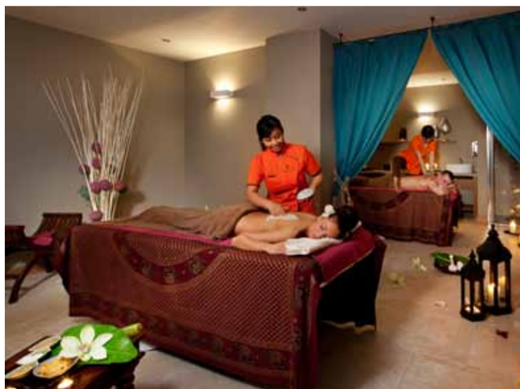
SPA Bali Hai - gabinet dla par.