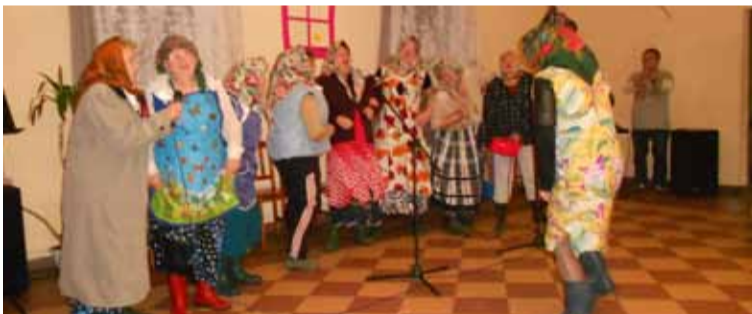
Święto Seniora to również czas zabawy.