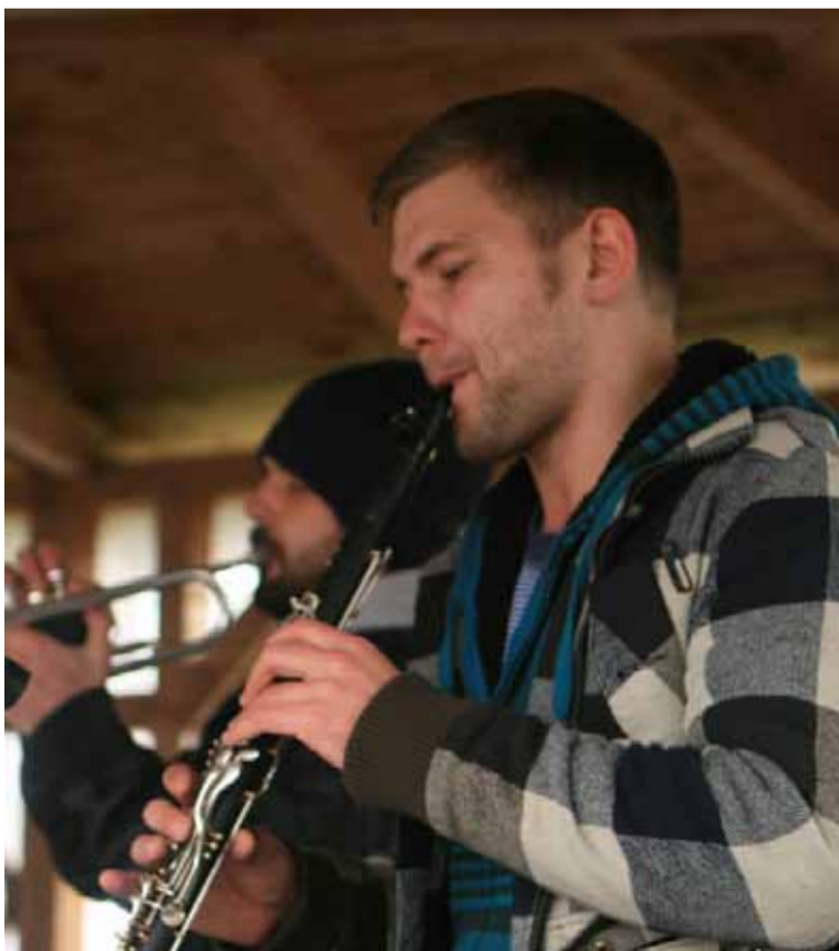
Gęsiny można było spróbować przy dźwiękach muzyki