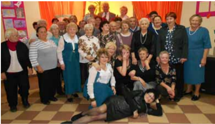
Seniorzy z Kusowa.

okazją do spotkania osób w starszym wieku, do spędzenia wspólnie czasu. Najwspanialsze jednak jest to, że wszyscy czekają na to spotkanie. Zarówno pani jak i panowie wiele czasu poświęcają na przygotowanie się do tego spotkania. Odwiedzają fryzjera, z szaf wyjmują najelegantsze stroje, a całość dopełnia dobry humor. Nic więc dziwnego, że te spotkania zawsze bardzo przyjemne.