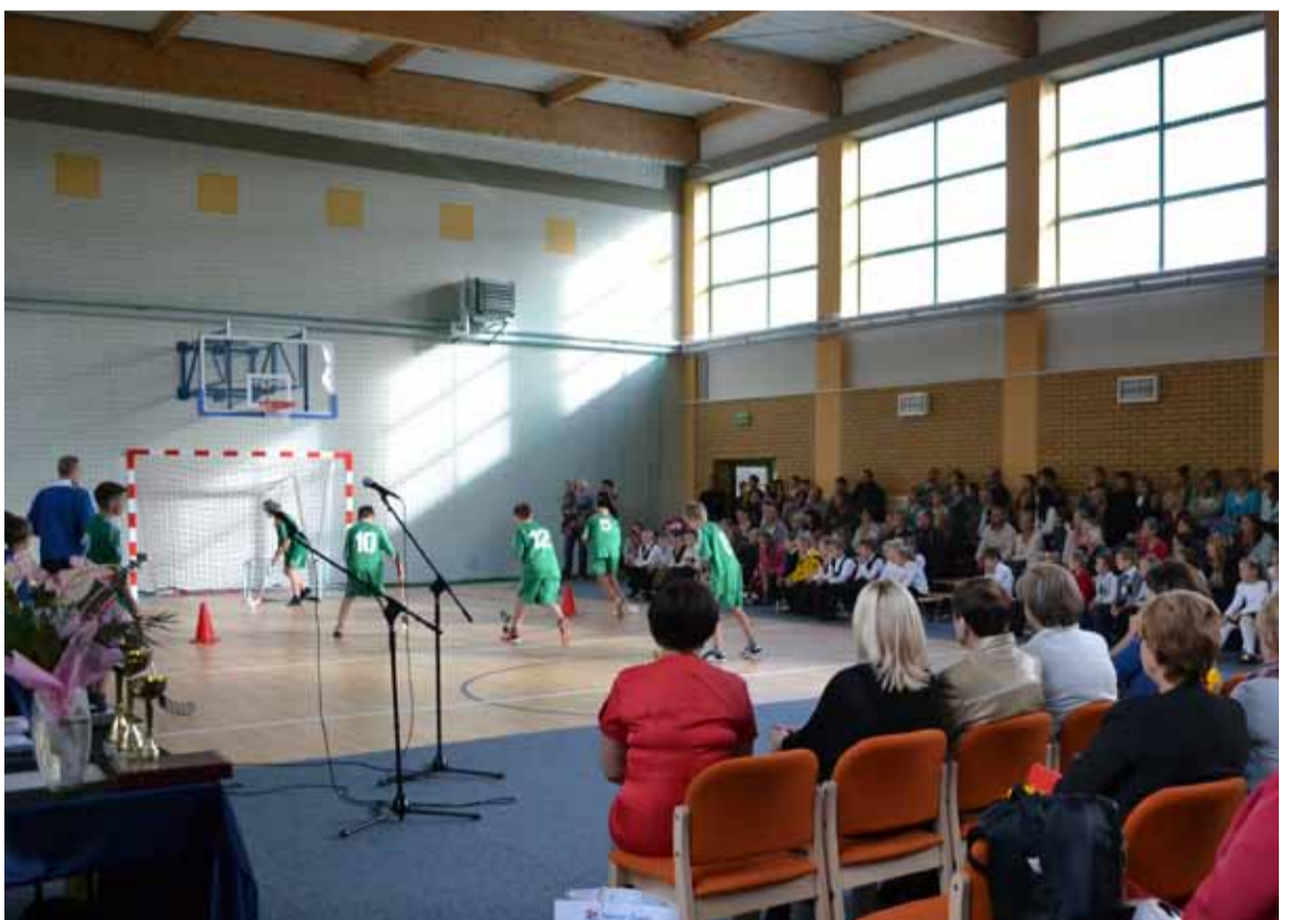
Dzieci przygotowały występ artystyczny na sportowo.

Projekt był finansowany z Programu Rozwoju Obszarów Wiejskich na lata 2007 – 2013 w ramach działania 313,322,323 "Odnowa i rozwój wsi".