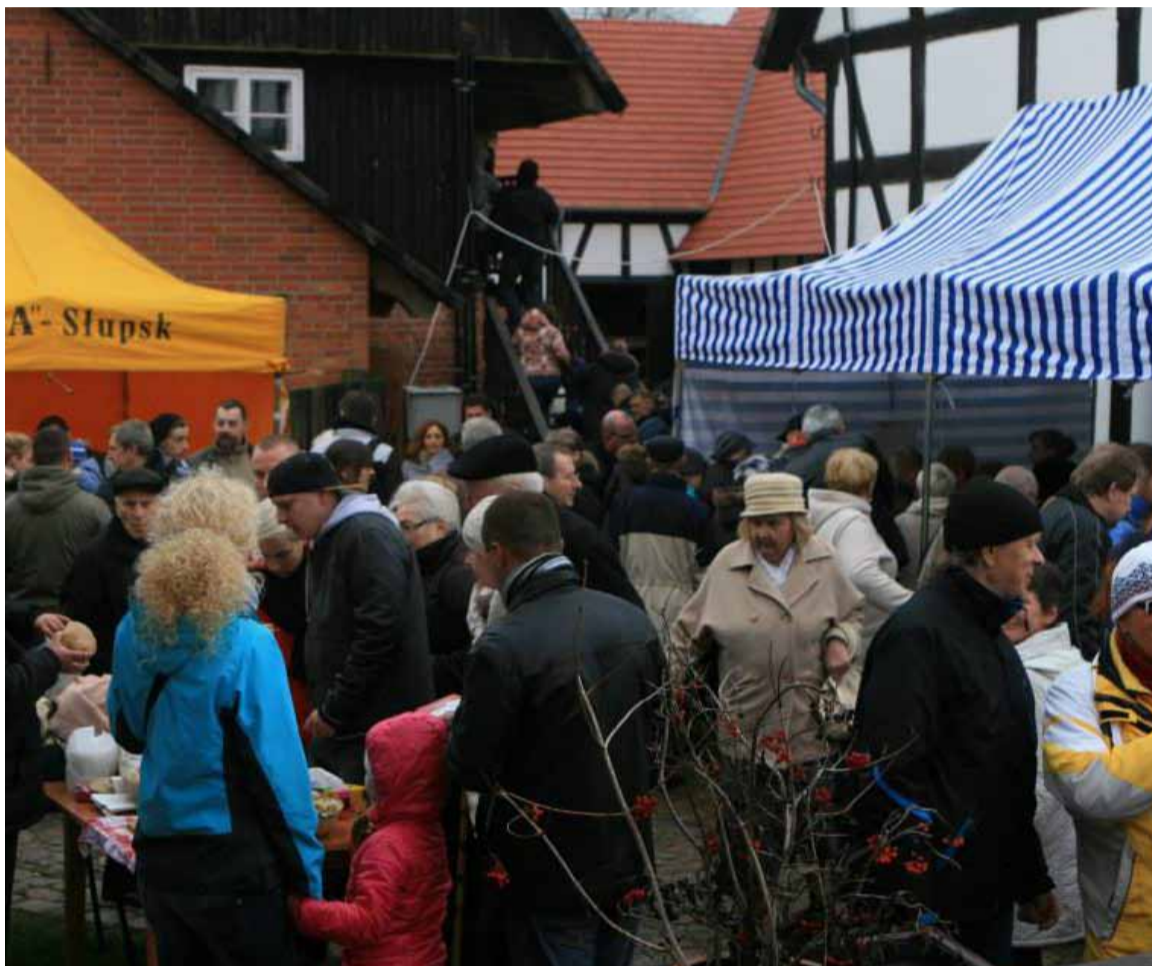
Muzeum w Swołowie było oblegane w pierwszym dniu imprezy...

„Na św. Marcina najlepsza pomorska gęsina” to największa impreza tego typu w kraju organizowana w tej części roku. Po raz pierwszy trwała aż 3 dni i w każdym nie brakowało tłumów. Kto wie czy za rok organizatorzy nie zdecydują się na przedłużenie festiwalu o kolejny dzień?