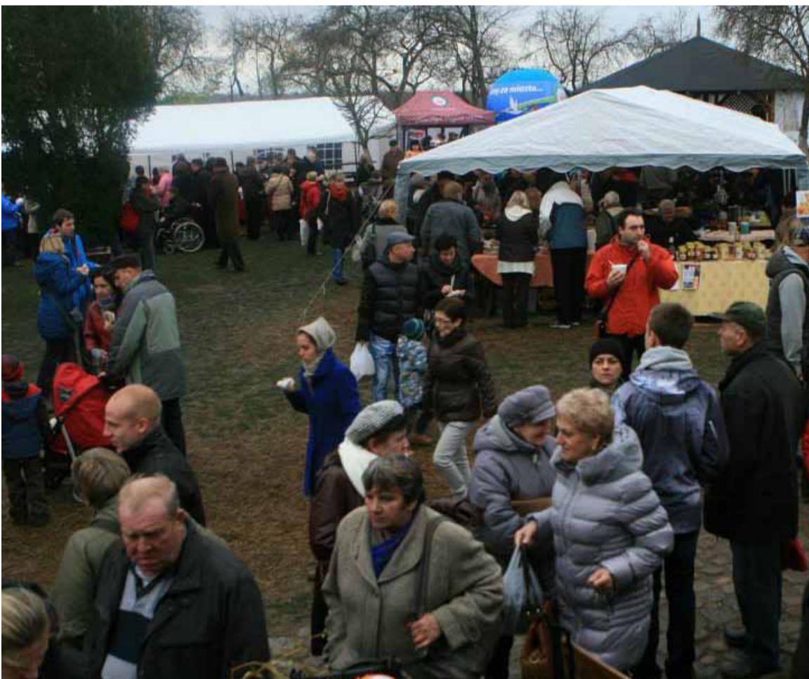
... w drugim i trzecim dniu nic się nie zmieniło