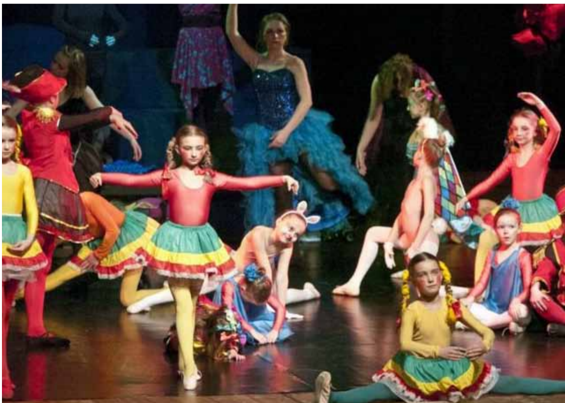
Musical Magiczny sklep

Bilety wstępu kosztują 20zł normalny i 12 zł ulgowy do nabycia w kasie Filharmonii przy ul. Jana Pawła II 3 Słupsk, tel. (59) 842-38-39 pn-pt 9:00 – 17:00.