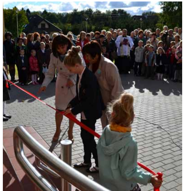
Przewodnicząca samorządu szkolnego przecina wstęgę.