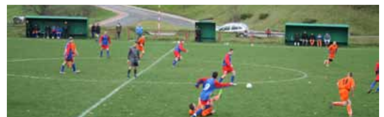
Dąb Kusowo w akcji.