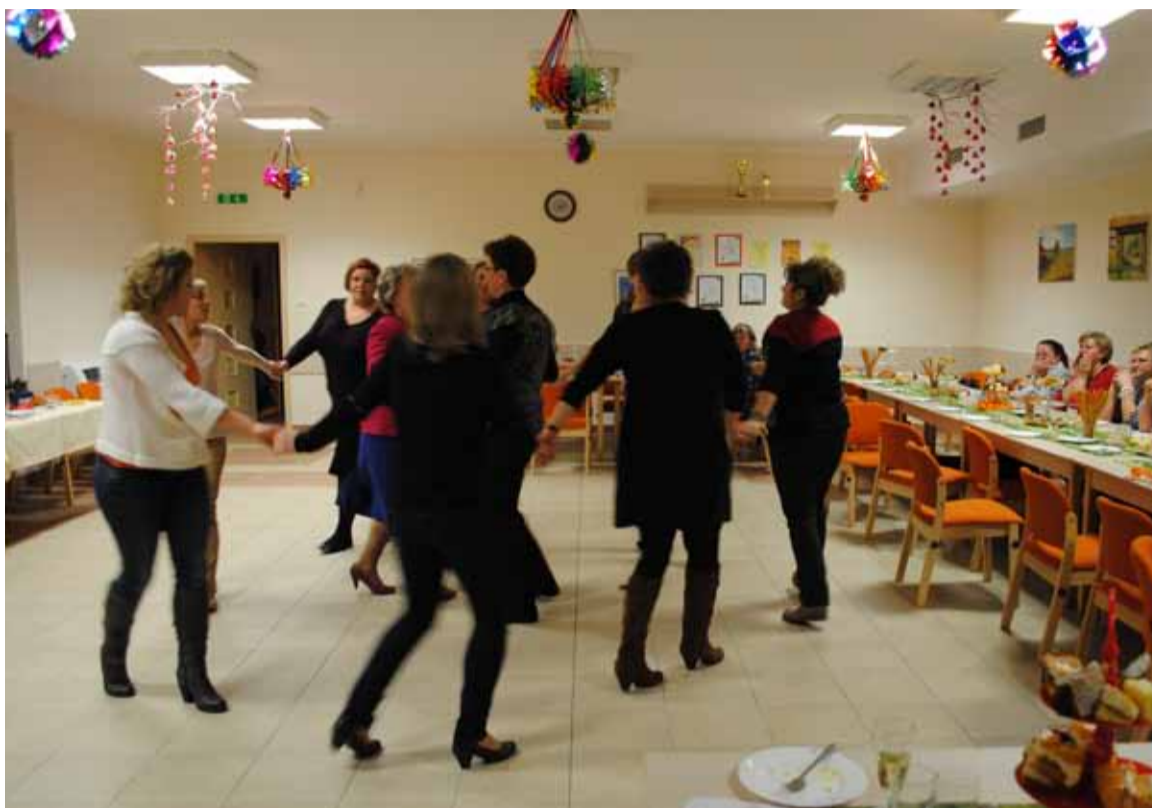
3 koła wzięły udział w spotkaniu będącym przygotowaniem do zmagani powiatowych

Gospodarze spotkania przygotowali sporo smakołyków, którymi zachwycali się goście i koleżanki z innych Kół Gospodyń Wiejskich. Dalsza część upłynęła pod znakiem wspólnych śpiewów i tańców. Uczestnicy spotkania równie chętnie wzięli udział w zabawach przygotowanych przez GOK Głobino. Koła najlepiej sprawdziły się w układaniu rymowanek.