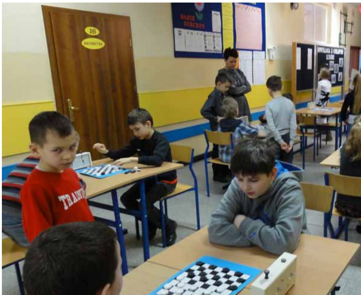
Kiedy gra toczy się o nagrody, okazuje się, że warcaby nie należą do najprostszych gier