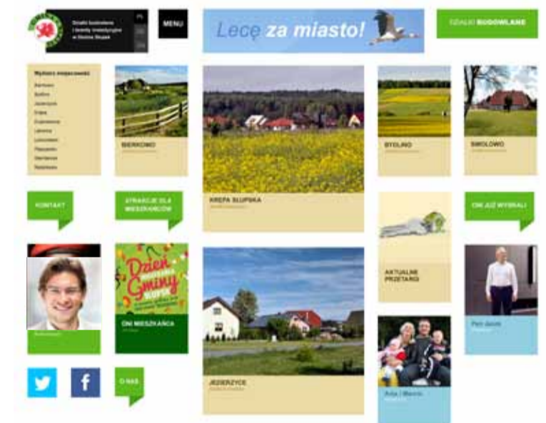
Nowy layout strony "Lecę za miasto" ułatwi znalezienie potrzebnych informacji.

O miejscowość Wiklino zwiększyła się oferta inwestycyjna działek budowlanych gminy. Tereny położone w tej miejscowości, będą dostępne za cenę 7,50 zł/m 2 . Jest to nowa, ciekawa oferta na rynku nieruchomości budowlanych. W zamian za tak niską cenę inwestor kupując działkę w drodze rokowań, zobowiązuje się do wybudowania domu i zameldowania się w gminie Słupsk, w ciągu 5 lat od daty nabycia nieruchomości.