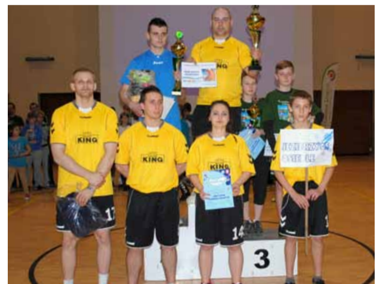
Pierwsza trójka Zimowego Turnieju Solectw. Czy w letniej edycji zajdą zmiany na podium?

Przed ostatnim etapem Zimowego Turnieju Solectw, suma punktów, nie dawała jeszcze nikomu gwarancji zwycięstwa. Wszystko rozstrzygnąć miało przeciąganie liny. Tutaj systemem pucharowym solectwa próbowały dostać się do finału. Premiuwane dodatkowymi punktami były drużyny z miejsc 1-8. Pozostałe solectwa otrzymały po 4 pkt. W wielkim finale, bardzo zacięty bój stoczyły solectwa Jezierzycy Osiedle i Gałęzinowo. Mimo że zawodnicy z Jezierzycy byli bardzo bliscy przeciągnięcia liny na swoją stronę,