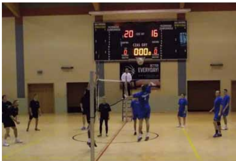
Mecze Amatorskiej Ligi Siatkówki to emocje nie tylko dla uczestników