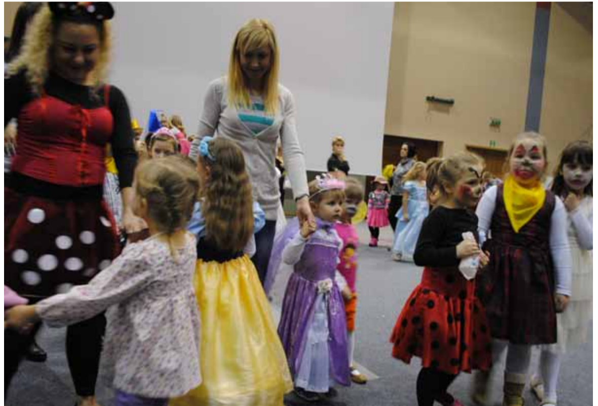
Podczas tegorocznego balu pobito rekord frekwencji

gminy Słupsk można znaleźć foto- i wideorelację z bajkowej premiery. W najbliższym czasie będzie można tam również obejrzeć całą bajkę