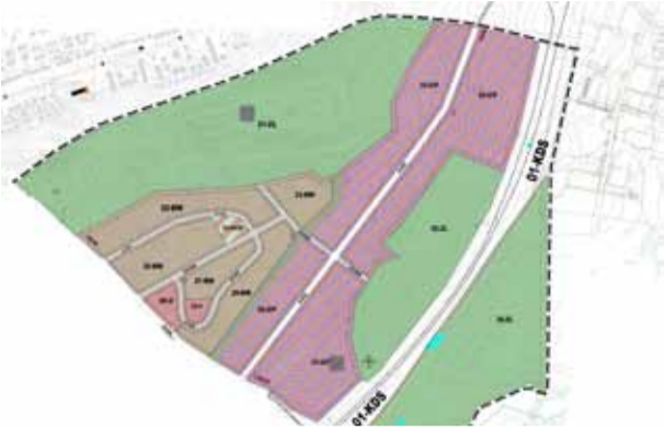
Plan Zagospodarowania Przestrzennego terenu inwestycyjnego Płaszewko.

Wraz z nadejściem nowego roku, można zauważyć większy ruch na rynku nieruchomości. Wychodząc naprzeciw wszystkim inwestorom gmina Słupsk, poszerza swoją ofertę o nowe tereny inwestycyjne. Nowy teren dla biznesu – Płaszewko oraz nowy teren dla inwestorów indywidualnych – Wiklino.