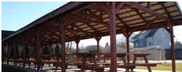
Budowa wiaty zakończyła się w zeszłym roku. Obiekt zlokalizowany jest obok świetlicy wiejskiej i boiska sportowego.

Wcześniejsze nazwy miejscowości: Beddelin (1502), Beddlin (1658), Bedlin (1622). Forma gwarowa Bedleno. Jest to nazwa topograficzna od nazwy grzyba bedłka, obecna nazwa została utworzona przez skojarzenie ze słowem bydło. W 1923 r. wybudowano dwór w Bydlinie. Wcześniej