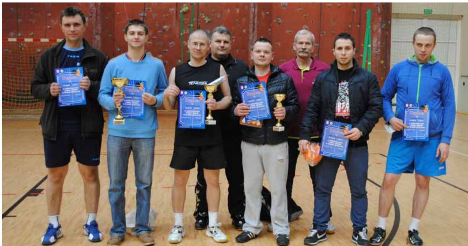
Pierwsi gminni mistrzowie tenisa stołowego w kategorii OPEN wraz z organizatorem i sędzią turnieju.