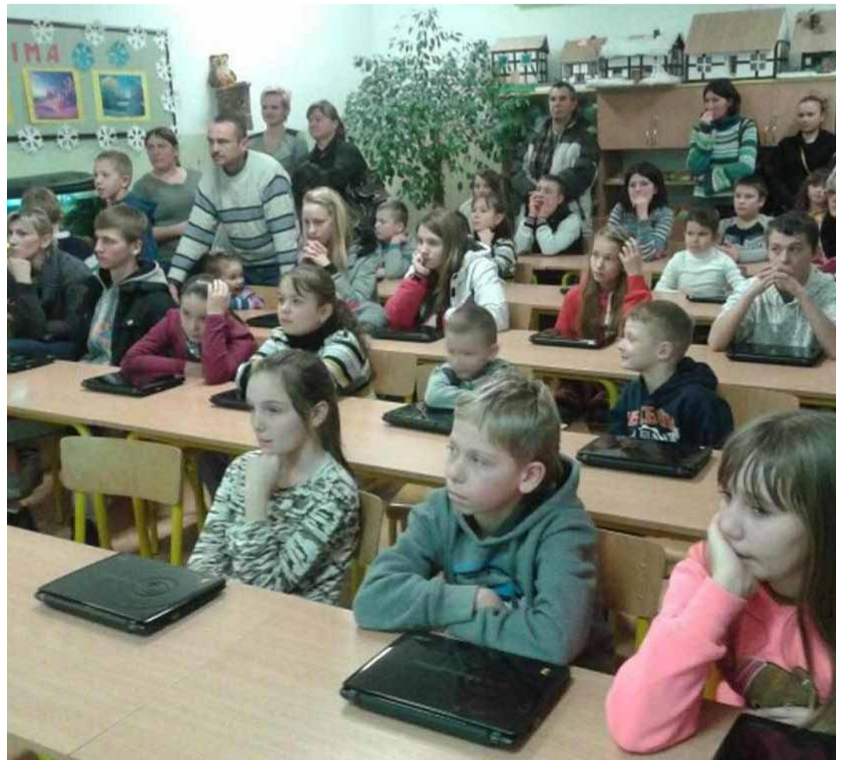
Szkoła Podstawowa w Bierkowie powiększy się o grono uczniów, którzy przeniosą się ze szkoły w Sycewiczach

nauki pływania w Parku Wodnym Redzikowo w ramach lekcji wychowania fizycznego już od 1 klasy.