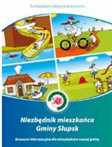
"Niezbędnik" to zbiór najważniejszych telefonów i adresów w całym regionie

W marcu minęły dwa lata, od kiedy gmina Słupsk ruszyła z kampanią informacyjną « Tu mieszkam i płacę, tu korzystam ». W ciągu 2 lat zameldowało się niemal 500 nowych mieszkańców. Celem głównym było uświadomienie niez-