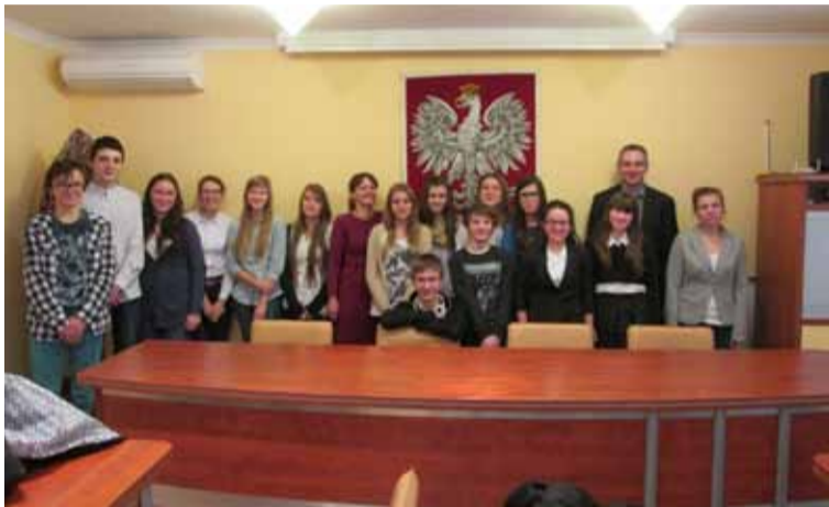
Gości z Siemianic na sali konferencyjnej urzędu przyjął Sekretarz Gminy Słupsk

niów i nauczycieli do krajów partnerskich z Rumunii, Łotwy, Turcji, Włoch, Węgier i Bułgarii oraz przyjęcie wszystkich partnerów w Siemianicach w czerwcu 2015 roku. Wielki finał i podsumowanie projektu nastąpi już za dwa lata!