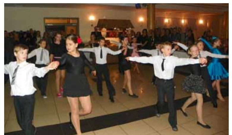
Uczniowie z Siemianic podczas prezentacji jednego z kilku układów tanecznych