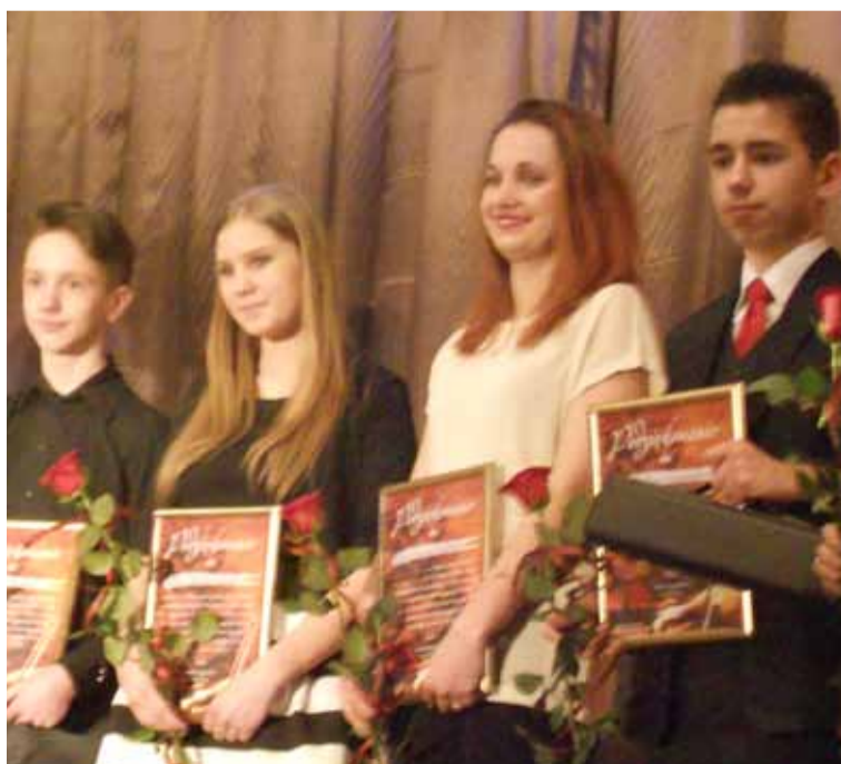
Młodzież gminy Słupsk śpiewająco recytowała poezję