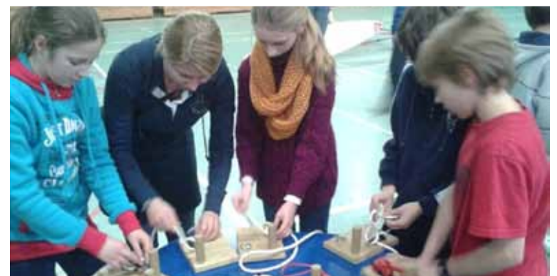
Uczniowie klasy V