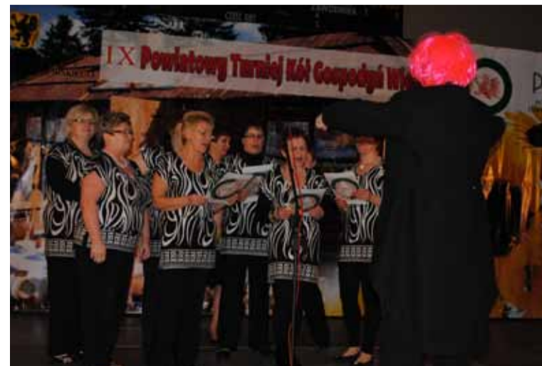
Panie z KGW Jezierzycze Osiedle wykonują piosenkę o swojej okolicy

w kwietniu. Niestety nie powiodło się obu kołom reprezentującym gminę Słupsk. Panie nie zdobyły nagrody w żadnej z konkurencji, ale w związku z wysokim poziomem wszystkich startujących, decydowały niuanse. Uczestnicy i kibicie jednogłośnie stwierdzili, że zabawa była fantastyczna, a na pewno przyczynia się do tego klimat jezierzyckiej hali. Już dziś zapraszamy na jubileuszowy odbędzie się w Jezierzycach. Więcej materiałów z imprezy znajdziecie na profilu facebook'owym gminy Słupsk.