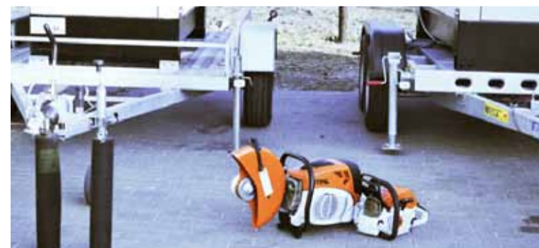
Nowy sprzęt cieszy ale jednocześnie mamy nadzieję, że nie będzie musiał być często używany

Cały ww. sprzęt stacjonował będzie w Zakładzie Gospodarki Komunalnej w Jezierzycach z przeznaczeniem do reagowania w razie wystąpienia sytuacji kryzysowych.